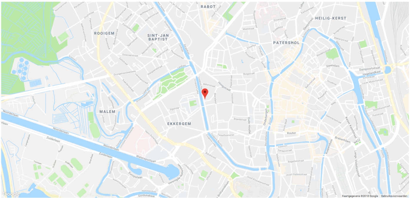
Image satellite et POI